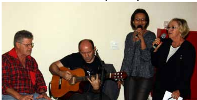
Boa música, com a participação de alguns presentes