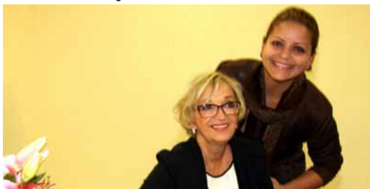
...e recebe o abraço dos amigos