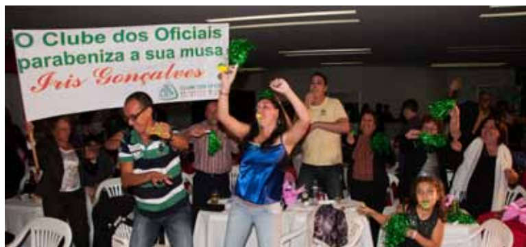
Torcida do COPM, com familiares da nossa candidata