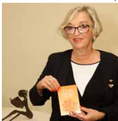
Geni autografa sua obra...